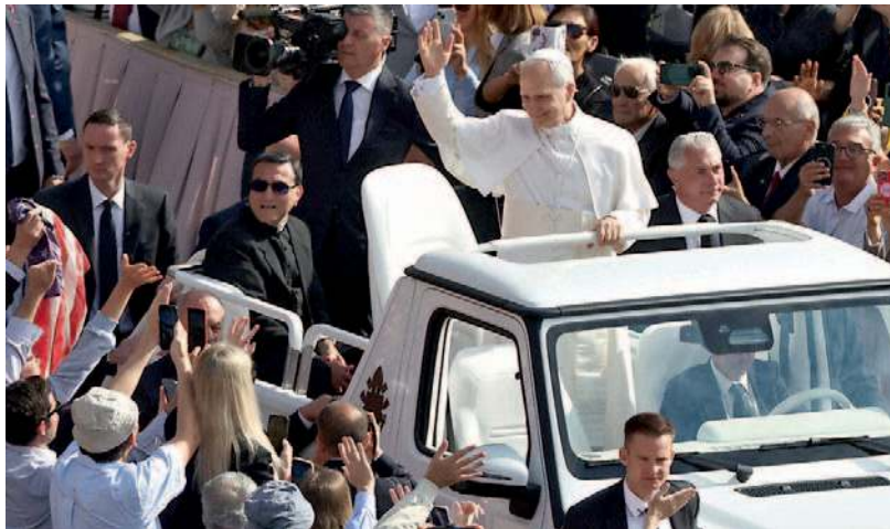
Papa Leone durante la cerimonia di insediamento in San Pietro

Leone lo conosce da un paio di mesi, i due sono vicini di casa a Palazzo Sant'Uffizio