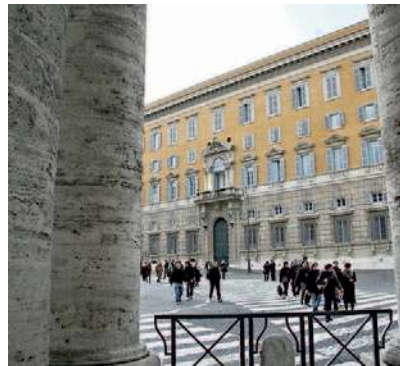
Il palazzo del Sant'Uffizio dove vivono Leone XIV e il cardinale Angelo Becciu

Non una riabilitazione ma un segno di attenzione. Papa Leone XIV ha ricevuto ieri il cardinale Angelo Becciu. L'udienza, si è limitata a dichiarare il cardinale, è andata «molto bene». Di più non dice, ma si capisce che si tratta del primo passo di un percorso che il porporato sardo spera condurrà ad accertare la propria innocenza. Una innocenza che Becciu protesta da sempre, ma che dovrà essere il tribunale vaticano, nel processo d'appello previsto in autunno, a verificare Francis Robert Prevost sta prendendo in mano i dossier del governo vaticano, e tra questi c'è l'affaire Becciu che ha agitato le sacre stanze fino alla vigilia della sua elezione al soglio petrino. Becciu, infatti, non ha partecipato al Conclave, ma il nodo della sua presenza o assenza ha tenuto banco nei primi giorni delle congregazioni generali, le riunioni di cardinali che hanno preceduto il voto in Cappella Sistina. E l'udienza di ieri, che di quel frangente è la logi-