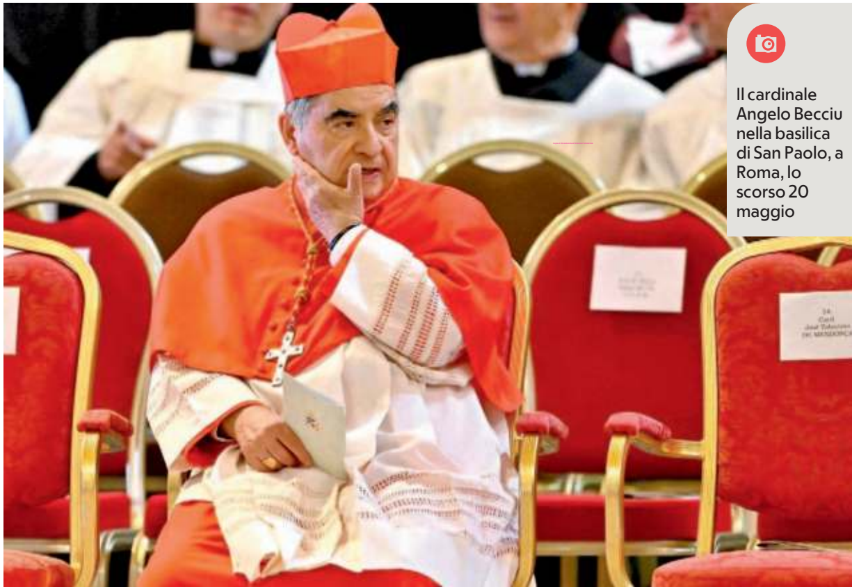
Il cardinale Angelo Becciu nella basilica di San Paolo, a Roma, lo scorso 20 maggio