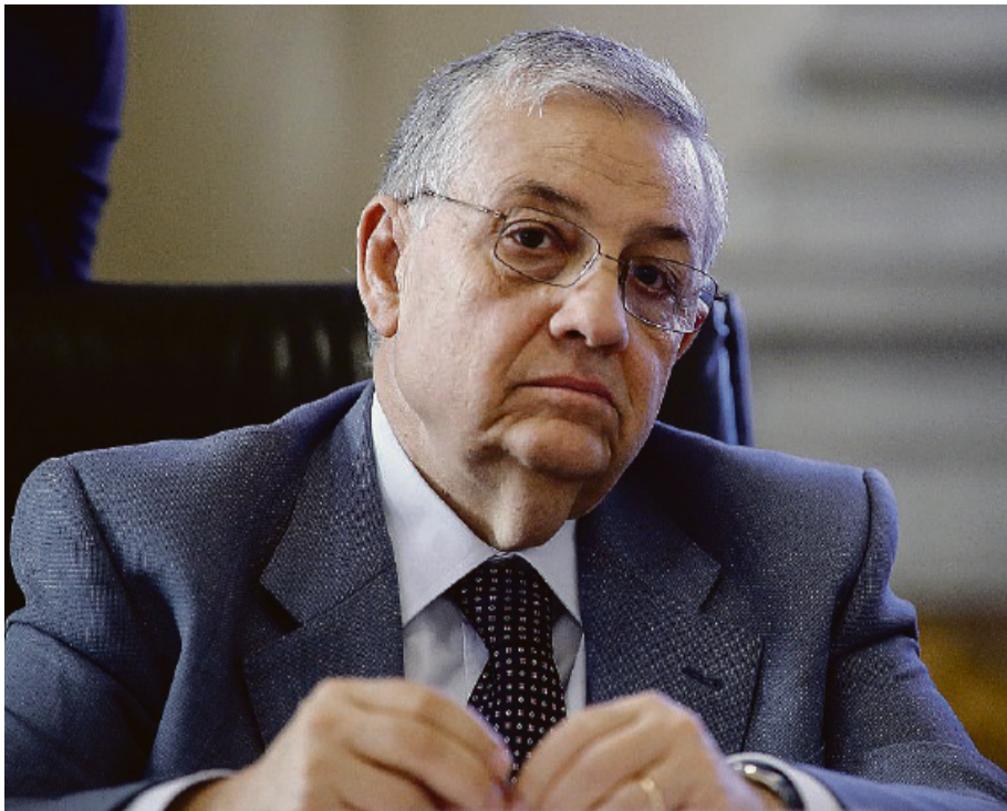
FILO ROSSO A sinistra, Giuseppe Pignatone, procuratore di Roma dal 2012 al 2019, anno in cui Francesco lo ha voluto alla guida del Tribunale del Vaticano; a destra, papa Francesco; sotto, il pentito Giovanni Brusca

(...) Piero Grasso . A quel punto, la sua scalata è diventata inarrestabile. Prima, aggiunto nel capoluogo siciliano, nel 2008 capo della Procura di Reggio Calabria e, nel 2012, addirittura di quella di Roma, con la benedizione del presidente Giorgio Napolitano . A questi incarichi si è, poi, aggiunto, sei anni dopo, quello di papa Francesco , il quale lo ha nominato presidente del Tribunale vaticano. Adesso, però, la carriera di Pignatone , per qualcuno, andrebbe riletta alla luce dell'inchiesta della Procura di Caltanissetta che lo ha indagato per favoreggiamento della mafia. Le carte recapitate alla commissione Antimafia nei giorni scorsi sono esplosive. Pignatone e l'ex collega Gioacchino Natoli sono