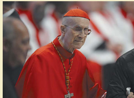
Tarcisio Bertone Anche lui sarà escluso dal voto per questioni d'età