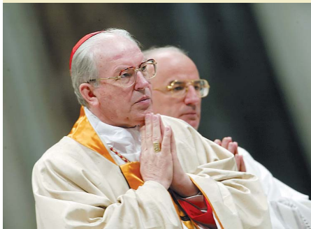
Giovanni Battista Re Celeberrà il funerale di Papa Francesco