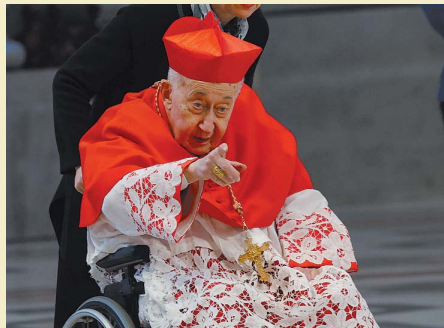
Camillo Ruini All'arrivo a San Pietro il 23 aprile. Non parteciperà al voto